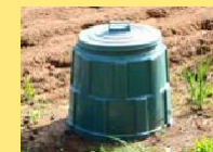
Phân hữu cơ

Gấu nâu là động vật rất nghiện thức ăn. Khi chúng đã nhớ mùi vị của rác sống (kể cả phân hữu cơ) và thức ăn của con người như trái cây, cá khô, v.v., chúng sẽ liên tục tiếp cận nhà cửa và con người. Dần dần chúng sẽ không sợ con người nữa. Nếu bạn sống trong khu vực có gấu nâu hay xuất hiện hoặc khi leo núi, hãy cẩn thận tuyệt đối để tránh nguy hiểm.