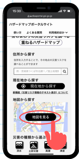
點擊“地圖を見る （查看地圖）”