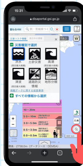
點擊當前位置的按鍵