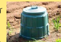
ปุ๋ยหมัก

หมีสีน้ำตาลเป็นสัตว์ที่รักอาหารมาก หากพวกมันได้จดจำรสชาติของอาหารมนุษย์ เช่น ชยะสด (รวมไปถึงปุ๋ยหมัก) ผลไม้ ปลาตากแห้ง ฯลฯ พวกมันจะเข้าใกล้บ้านของมนุษย์เพื่ออาหารเหล่านั้นแล้วซ้ำแล้วซ้ำเล่าและพวกมันจะเริ่มไม่เกรงกลัวมนุษย์อีกต่อไป ผู้ที่อาศัยอยู่ในบริเวณที่มีสีน้ำตาลปรากฏตัวหรือผู้ที่ต้องเดินทางเข้าไปในภูเขาควรระมัดระวังตัวเอาไว้เสมอเพื่อหลีกเลี่ยงสถานการณ์ที่อันตราย