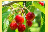
ผลเชอร์รี่