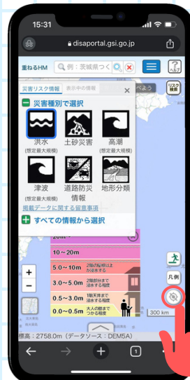
คลิกที่ปุ่มแสดงตำแหน่งปัจจุบัน “現在地へ移動”