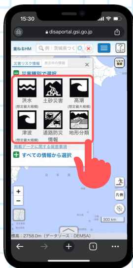
คลิกเลือกประเภทของภัยพิบัติที่ต้องการตรวจสอบ