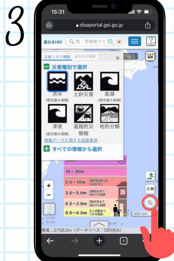
현재장소의 버튼을 클릭