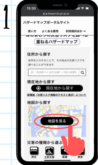
「地図を見る (지도보기)」를 클릭