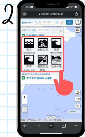
확인하고 싶은 재해의 종류를 클릭