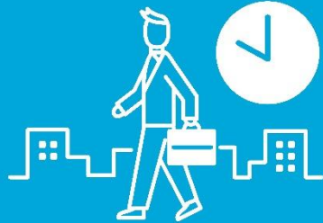
Pagpasok sa iba-ibang oras

Mga Panibagong pamamaraan isasagawa sa Hokkaido upang maiwasan ang paglaganap ng COVID-19.