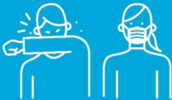
Wastong Etiketa sa pag ubo