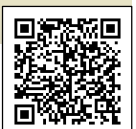
「바이러스 다음에 오는 것」 (일본적십자사)