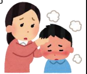
「신형 코로나 바이러스 감염증 COVID-19 진료 안내서(제5.2판)」