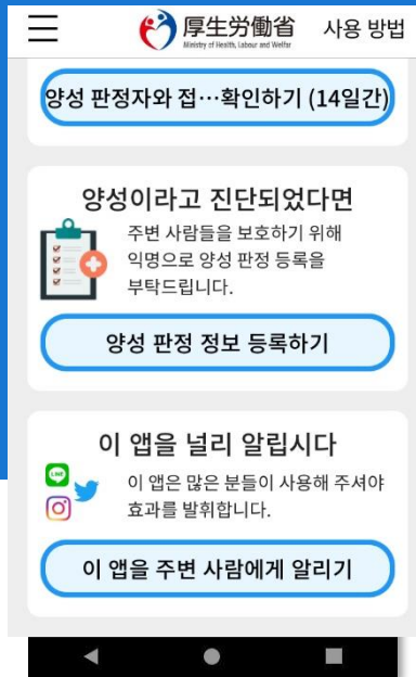
* 화면 이미지

접촉확인 어플은 코로나19 감염자와 접촉했을 가능성을 통지를 받을 수 있는 똑똑한 어플입니다.