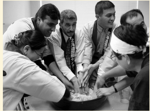
さあ、蕎麦打ちのはじまり

いまでは日本でもあまり見られなくなった獅子舞の獅子の口の中に頭を入れてもらって喜ぶ人、蕎麦打ちに自ら挑戦して粉だらけになってしまった人、日本の女性の着物姿や茶席の風情などの記念撮影に余念のない研修員など、みな童心に返ったようであった。