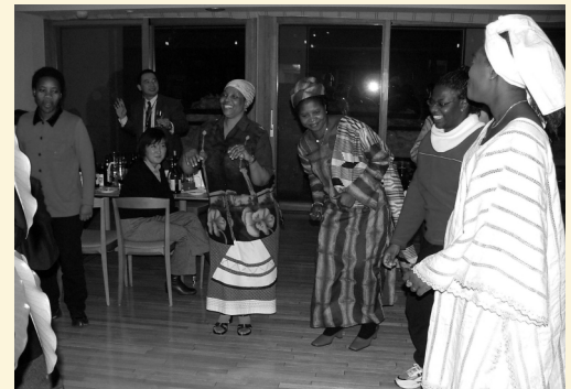
華やかな民族衣装で賑やかに

アフリカ出身の女性研修員の中には鮮やかな色彩の民族衣装を着て出席した人たちもあって、新年のお祝い気分を花を添えてくれた。