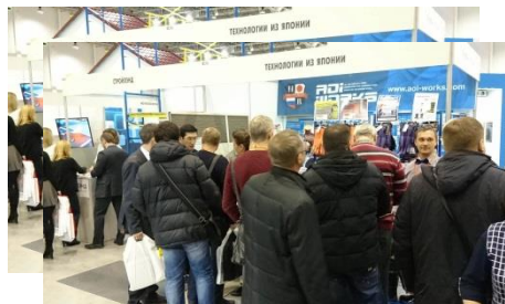
(写真：2017年2月展示会の様子)