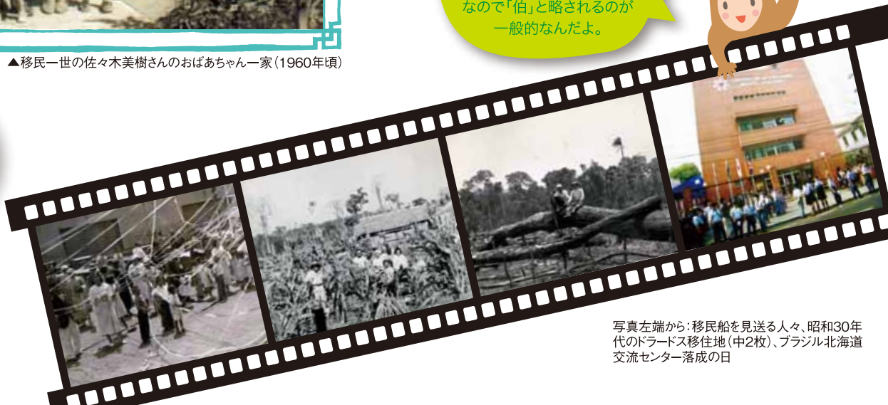
写真左端から：移民船を見送る人々、昭和30年代のドラードス移住地(中2枚)、ブラジル北海道交流センター落成の日